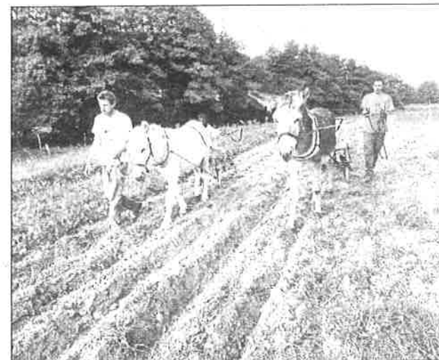
Formation de menage avec la Kassine (porte-outils pour le maraîchage et autres cultures sur petites surfaces)

Pour le travail sous serre, il n'y a plus de pollution issue des gaz d'échappement des moteurs. La fumure des animaux de traction permet en outre de produire du compost pour les cultures : avec 2 bêtes - 2 Unité-Gros-Bétail, il est possible de fertiliser de 0,25 à 0,5 ha de maraîchage. La traction animale permet de revitaliser des zones difficiles et abandonnées : des petites surfaces difficiles d'accès, en pente comme les terrasses, des zones de moyenne montagne ou de forêt. La traction animale fa-